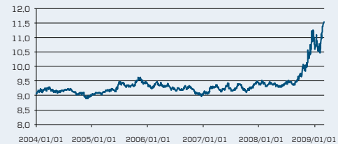
Valutakursutveckling för EURSEK de senaste fem åren 2)

Källa: Bloomberg (data mellan 2004-01-01 och 2009-03-02)